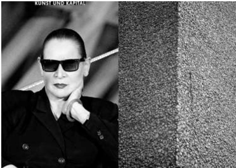
8. Katharina Sieverding KUNST UND KAPITAL 2017 © Katharina Sieverding, VG Bild-Kunst, Bonn 2017