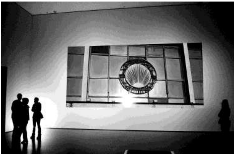
10. Katharina Sieverding ENCODE XI 2006 252 x 356 cm © Katharina Sieverding, VG Bild-Kunst, Bonn 2017