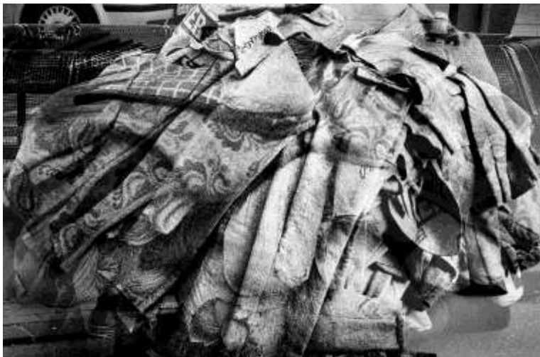
9. Katharina Sieverding ENCODE V 2006 252 x 356 cm © Katharina Sieverding, VG Bild-Kunst, Bonn 2017