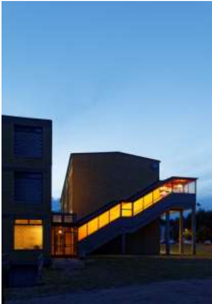
2. Gym at night 2017