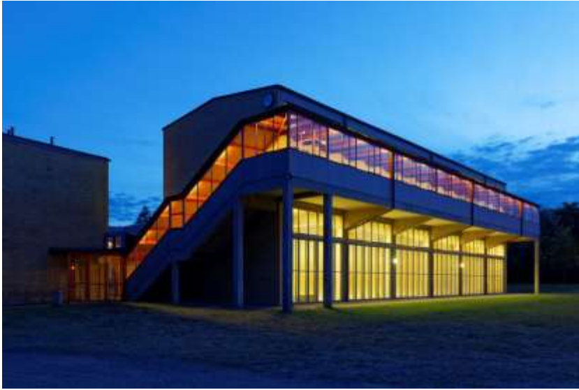
1. Gym at night 2017