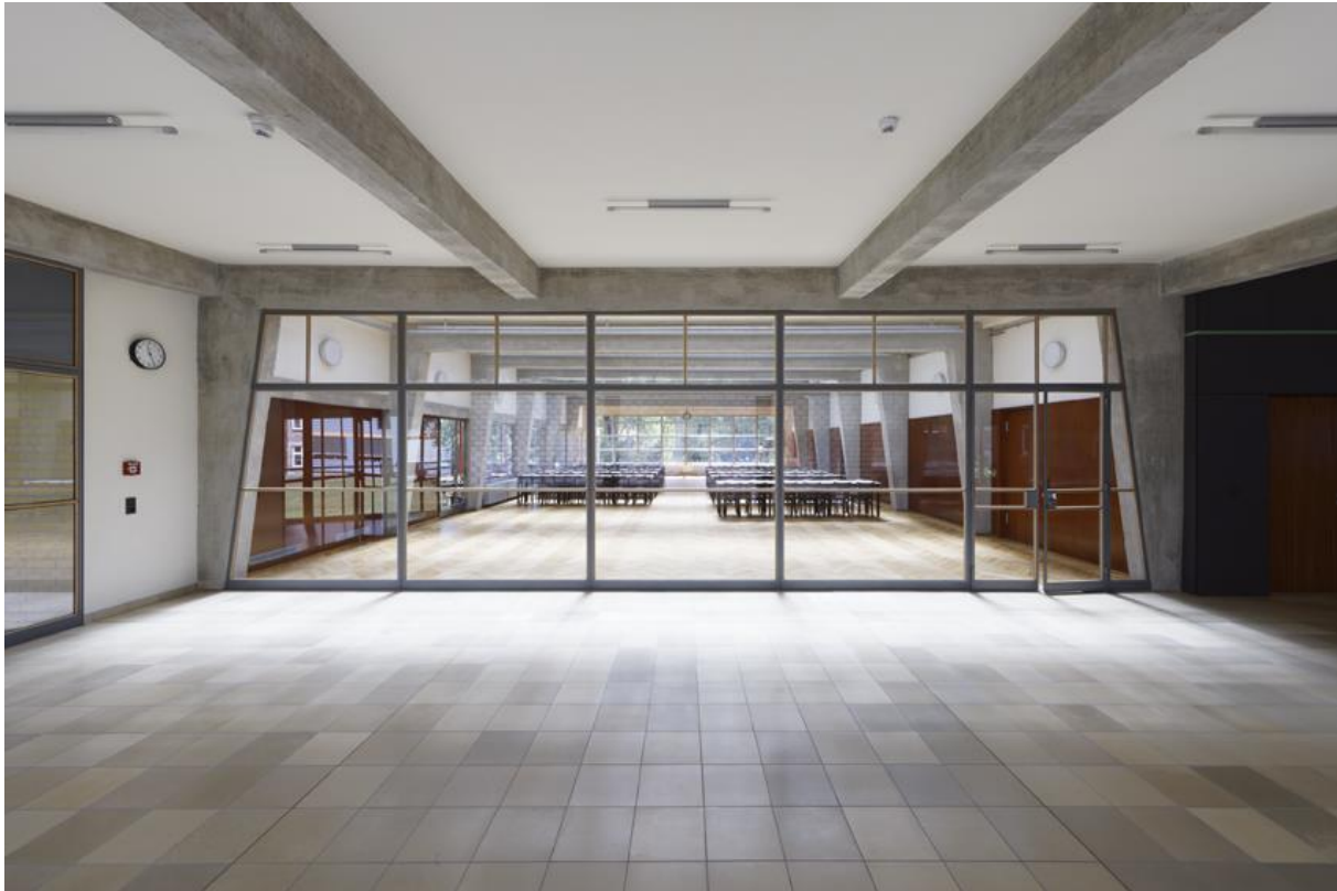
Foyer and dining hall, 2017, Photo: EBERLE & EISFELD © EBERLE & EISFELD